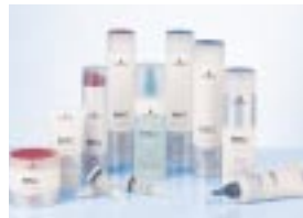
BC Bonacure Hairtherapy În exclusivitate la coafor.

Secretul părului frumos stă în mâinile profesioniștilor și în îngrijirea inteligentă a părului.